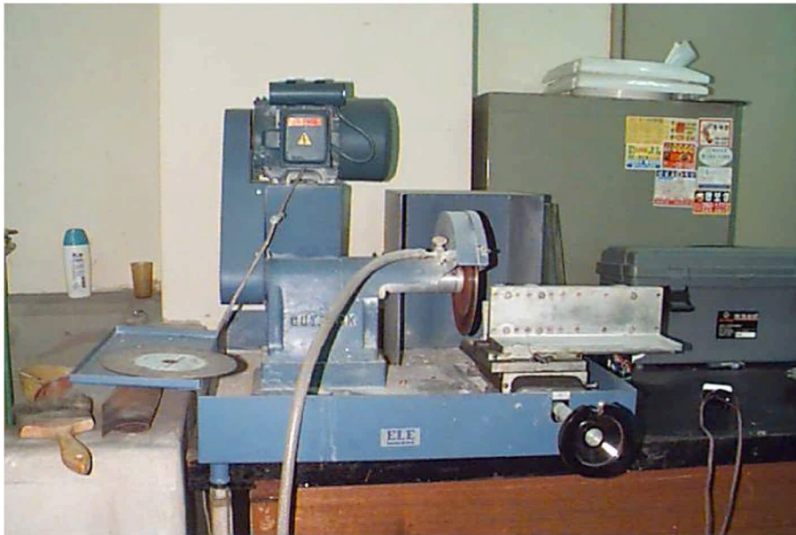
3. (Rock Cutter).